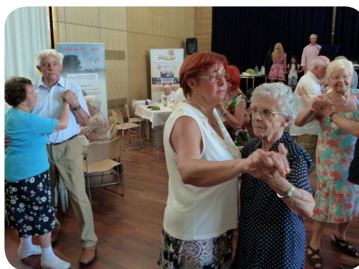
Beim Tanztee in Taufkirchen ging es heiss her!